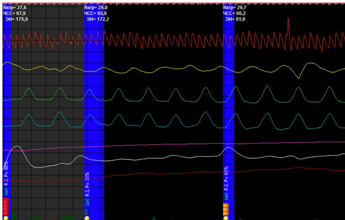
Рис. 2. Показатели физиологических реакций на завершающем этапе проработки

Показатель эмоционального напряжения (индекс напряжения по формуле Баевского) значительно снижается на завершающем этапе использования тренажера Master Kit.